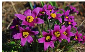
Na drugiej – mały bukiet sasaneek.