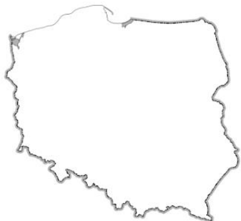
Mapa konturowa Polski

Rodziców proszę, aby wspólnie z dziećmi odszukali nasz region. Brawo! Udało się! Teraz z pomocą rodziców na konturze czystej mapy, zaznaczcie naszą miejscowość.